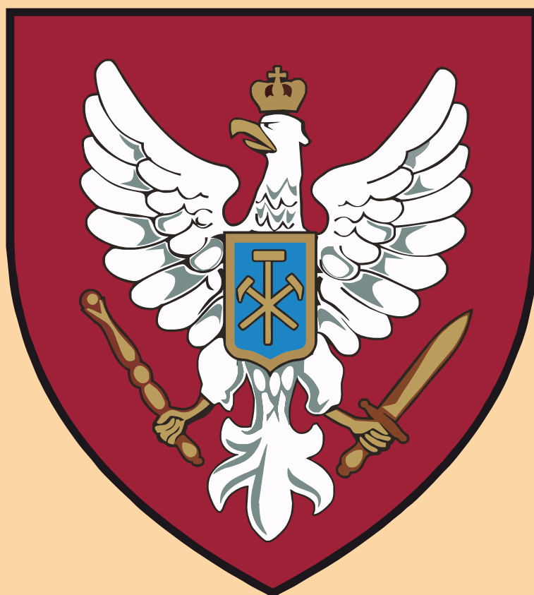
HERB STOWARZYSZENIA BOCHNIAKÓW I MIŁOŚNIKÓW ZIEMI BOCHEŃSKIEJ