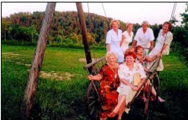
Na łonie natury.

W bożonarodzeniowy czas wprowadził nas w klimat melodyjnych kolęd z XVI, XVII i XVIII wieku, a w rocznicę wybuchu konfederacji barskiej zaśpiewaliśmy piękną Pieśń Konfederatów Barskich z poematu Ju-