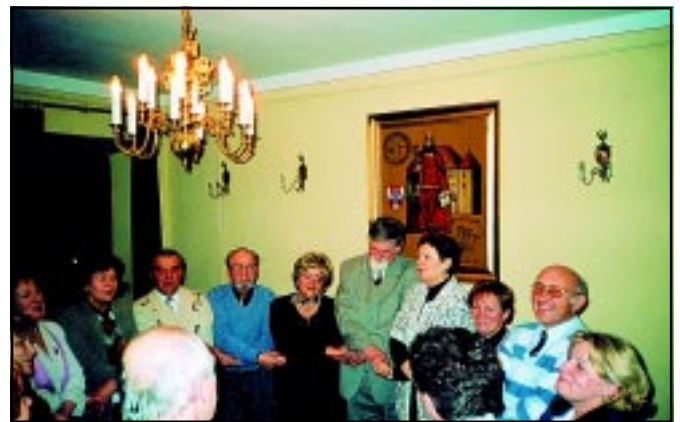
Nie zgaśnie tej przyjaźni żar...

Wycieczki do oddziałów Stowarzyszenia we Wrocławiu i Warszawie poprzedzone były starannym doborem