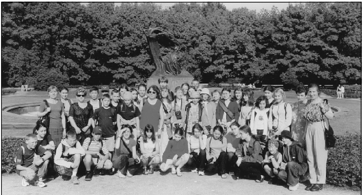
Pod pomnikiem Fryderyka Chopina w Warszawie.

Już o zmierzchu odwiedziliśmy Cmentarz Powązkowski. Na grobach rodziców Chopina, St. Moniuszki oraz kompozytorów i muzyków pochowanych w Alei Zasłużonych zapa-