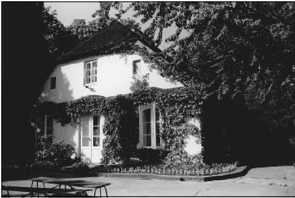
Dworek w Żelazowej Woli.