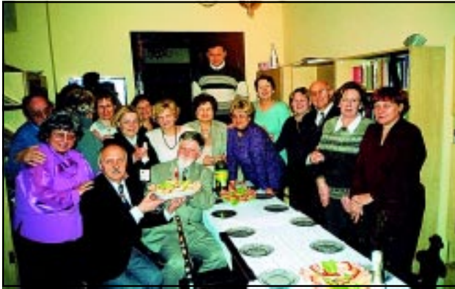
Uroczyste obchodzone pierwszą rocznicę powstania chóru.

W każdy czwartek o godzinie 18.00 do siedziby Stowarzyszenia Bochniaków spieszą członkowie chóru. „Wiadomości Bocheńskie” odnotowały, że chór rozpoczął działalność z końcem marca 2001 r. Do dnia dzisiejszego chór nie ma jeszcze nazwy, choć padały różne propozycje np. Cykady, Pospolite Ruszenie, Co wy na to? ale żadna propozycja się nie przyjęła. Po prostu pozostał „chór” i taką nazwą się posługujemy.